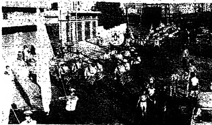
الكثافة تضيق شوارع الميناء